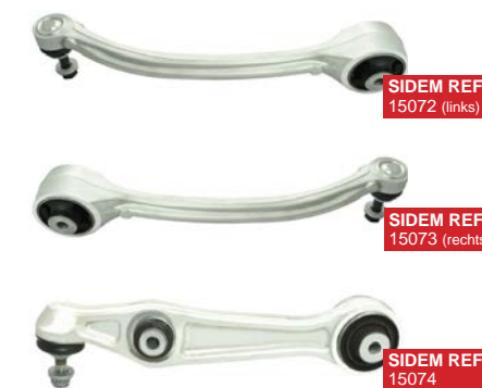
SIDEM REF 15072 (links)