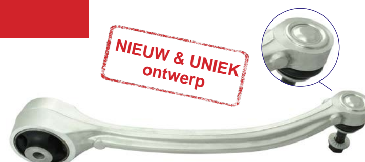
Het kogelgewricht zit volledig ingesloten in de aluminium behuizing van de arm.

In tegenstelling tot het zwakke verbindingstuk van het ingedrukte kogelgewricht in de draagarm van de Tesla-auto's, biedt deze vervangende draagarm van Sidem, bestaande uit één stuk , een maximale weerstand. Het kogelgewricht kan niet losraken wanneer het wordt blootgesteld aan hevige schokken. Bijgevolg wordt een veilige installatie gegarandeerd voor monteurs en chauffeurs.